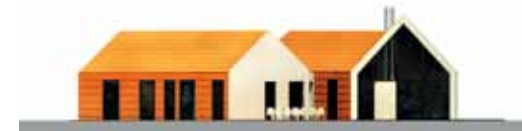
ELEWACJA POŁUDNIOWA: po lewej stronie widoczna jest sypialna część domu, na środku dziedzińca, a po prawej przeszklona ściana strefy dziennej