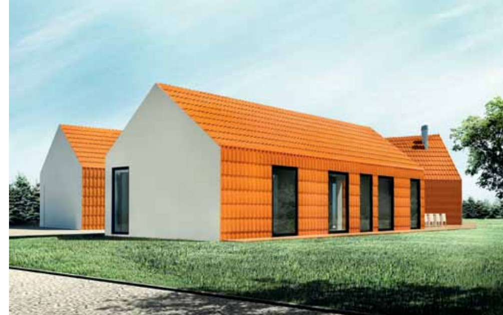
DOM DO SPANIA Część prywatna mieszkańców znalazła się w odrębnej części domu. Duże okna należą do sypialni dzieci i rodziców

Parterowy budynek został w wyraźny sposób podzielony na dwie części: dzienną w większej, załamanej części oraz prywatną – nocną w mniejszej części. Łączy je pawilon z płaskim dachem, w którym znalazło się wejście i ciąg komunikacyjny. Usytuowanie obu skrzydeł domu pozwoliło stworzyć rodzaj zewnętrznego dziedzińca. Widać go zarówno ze strefy dziennej, jak i z sypialni. Salon z jadalnią i kuchnią został zaprojektowany jako przestrzeń otwarta.