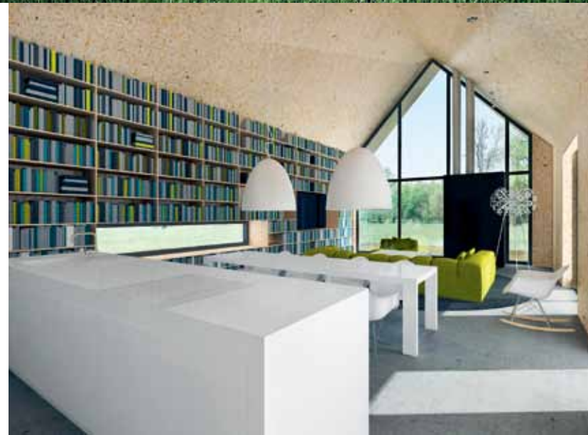
OTWARTA PRZESTRZEŃ Wydłużona bryła mieści rozległą przestrzeń dzienną z kuchnią, stołem jadalnym i częścią wypoczynkową otwierającą się poprzez przeszkloną ścianę na ogród