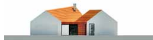
ELEWACJA PÓŁNOCNA: z tej strony najlepiej widoczna jest struktura domu – dwie części ze spadzistymi dachami i przeszklony łącznik z wejściem na środku

Ściany konstrukcyjne można zbudować z pustaków ceramicznych lub silikatowych. Na zewnętrznej stronie elewacji zastosowano fasadę wentylowaną obłożoną dachówkami ceramicznymi umieszczonymi na drewnianym ruszcie. Więźba dachowa ma drewnianą konstrukcję i to samo pokrycie co elewacje. Zastosowano stolarkę aluminiową w kolorze grafitowym. Na tarasie ułożono drewno egzotyczne. ■