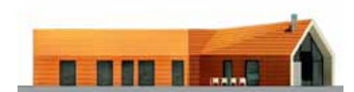
ELEWACJA ZACHODNIA: na tę stronę wychodzi większość okien sypialni. Zachodnie światło doświetla także salon i jadalnię