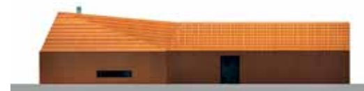
ELEWACJA WSCHODNA: w gładkiej elewacji obłożonej dachówkami ceramicznymi rysują się poziome pasmowe okno w kuchni i większe w gabinecie